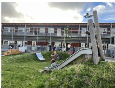
Børnehuset i Svinget